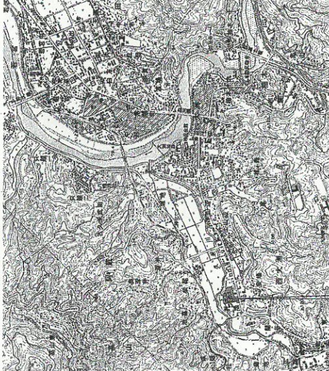
附近見取図 S=1:25,000 申請地：大洲市西大洲甲570番地